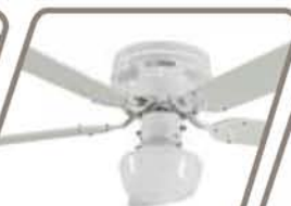
BRISA 1 LUZ Pág. 35