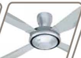
KDK DE LUXE Pág. 48