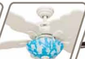
NUBE Pág. 40