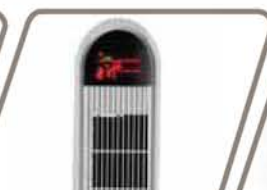
K2 Pág. 59