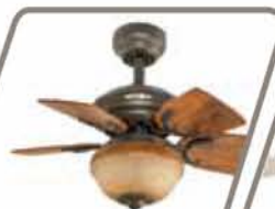
CÉFIRO Pág. 39