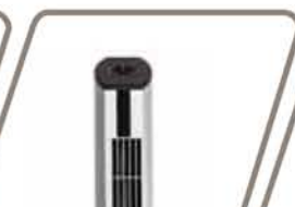
TEIDE Pág. 57