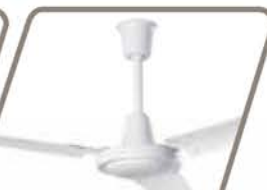
GRECO Pág. 55