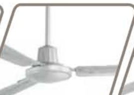
TORMENTA Pág. 52-53