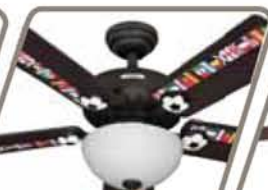
COPA DEL MUNDO Pág. 41