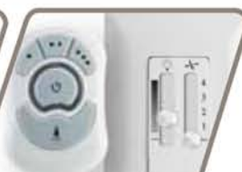
CONTROLES Pág. 60-61