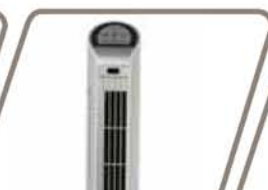
EVEREST Pág. 58