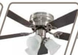
BRISA 3 LUCES Pág. 34