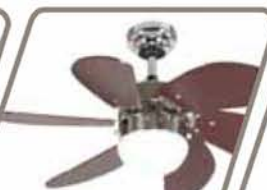
TRAMONTANA Pág. 36-37