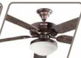
HURACÁN CON LUZ Pág. 44