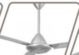
KDK REDONDO Pág. 51