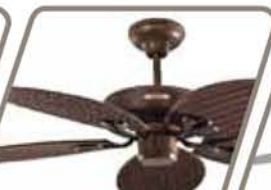
HURACÁN TROPICAL Pág. 46