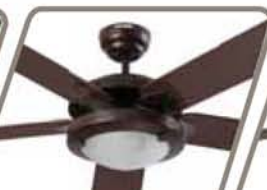
VENDAVAL OUTDOOR Pág. 42-43