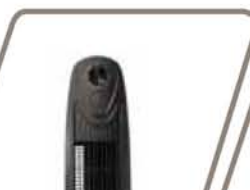
MATTERHORN Pág. 56