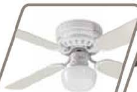
GARBI Pág. 33