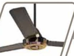
KDK CILÍNDRICO Pág. 50