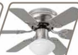
BALI Pág. 38