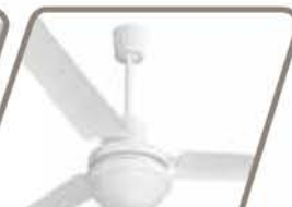
TORMENTA CON LUZ Pág. 49