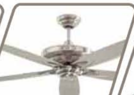
CALIMA Pág. 47