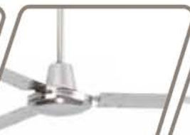
RÁFAGA Pág. 54