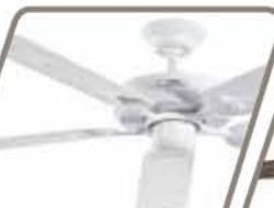
HURACÁN SIN LUZ Pág. 45